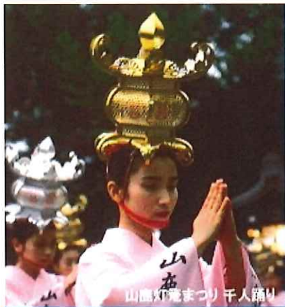
山鹿神楽まつり千人踊り